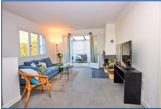
Coup de cœur

Référence 1977 Proximité écoles, commerces et campus HEC. Cette maison individuelle vous séduira par son emplacement et la luminosité de ses pièces. Le séjour double (4ème chambre possible) carrelé avec cheminée donne sur balcon et jolie véranda, la cuisine est aménagée, la chambre principale est au niveau de la douche et du wc. Une chambre et un bureau constituent les combles aménagés et une belle pièce de 20m 2 ainsi que la buanderie, la chaufferie et le garage à vélos se trouvent en rez-de-jardin. L'ensemble est chauffé au gaz et est habitable sans travaux.